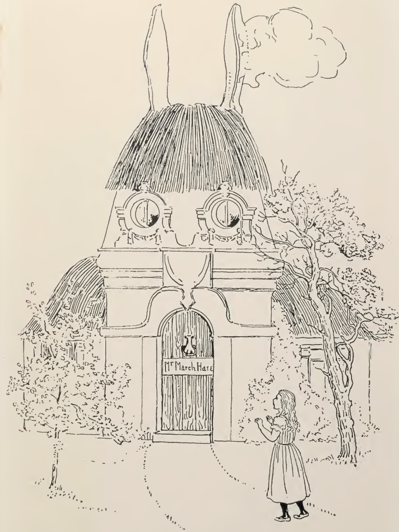
DOMO DE LA MARTLEPORO.

ne kuraĝis alproksimiĝi ĝis ŝi mordetis iom de la maldekstra fungopeco, kaj altigis sin ĝis proksimume sepdek centimetroj. Havante tiun altecon ŝi marŝis rekte al la domo, sed ŝi ankoraŭ iom timis dirante al si:—“Malgraŭ ĉio ĝi povas esti furioze freneza. Preskaŭ mi volus esti irinta ĉe la Ĉapeliston.